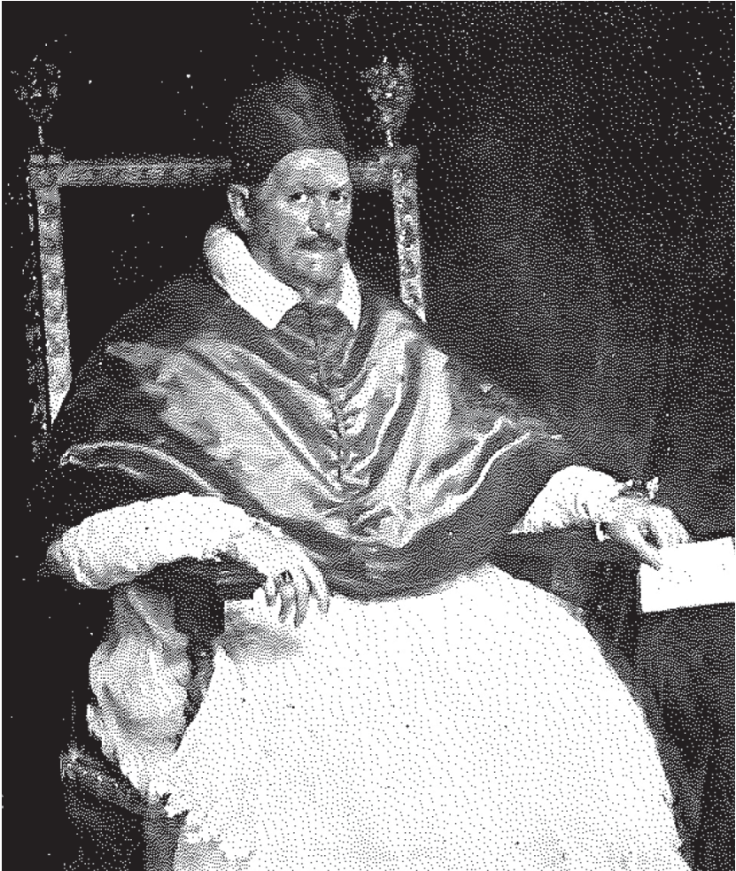
Innocencio X (1644-1655)